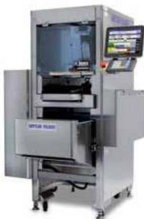
Solución de pesaje y envasado automáticos 870