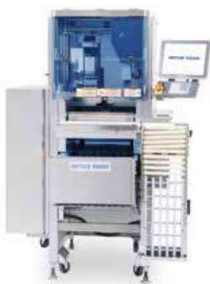
Solución de pesaje, envasado y etiquetado automáticos 880